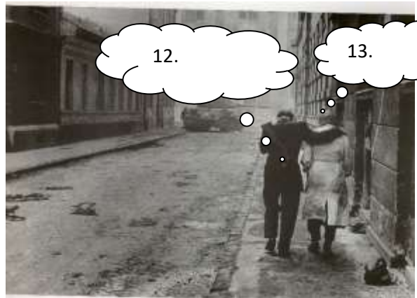
November 4-én hajnalban megindult a nagyarányú szovjet támadás Magyarország ellen, a kézfegyverekkel felszerelt felkelők azonban az egyenlőtlen küzdelemben csak néhány napig voltak képesek ellenállni