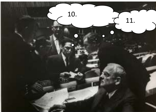
A helyzet egyre feszültebbé vált, a magyar kormány az ENSZ-hez fordult.