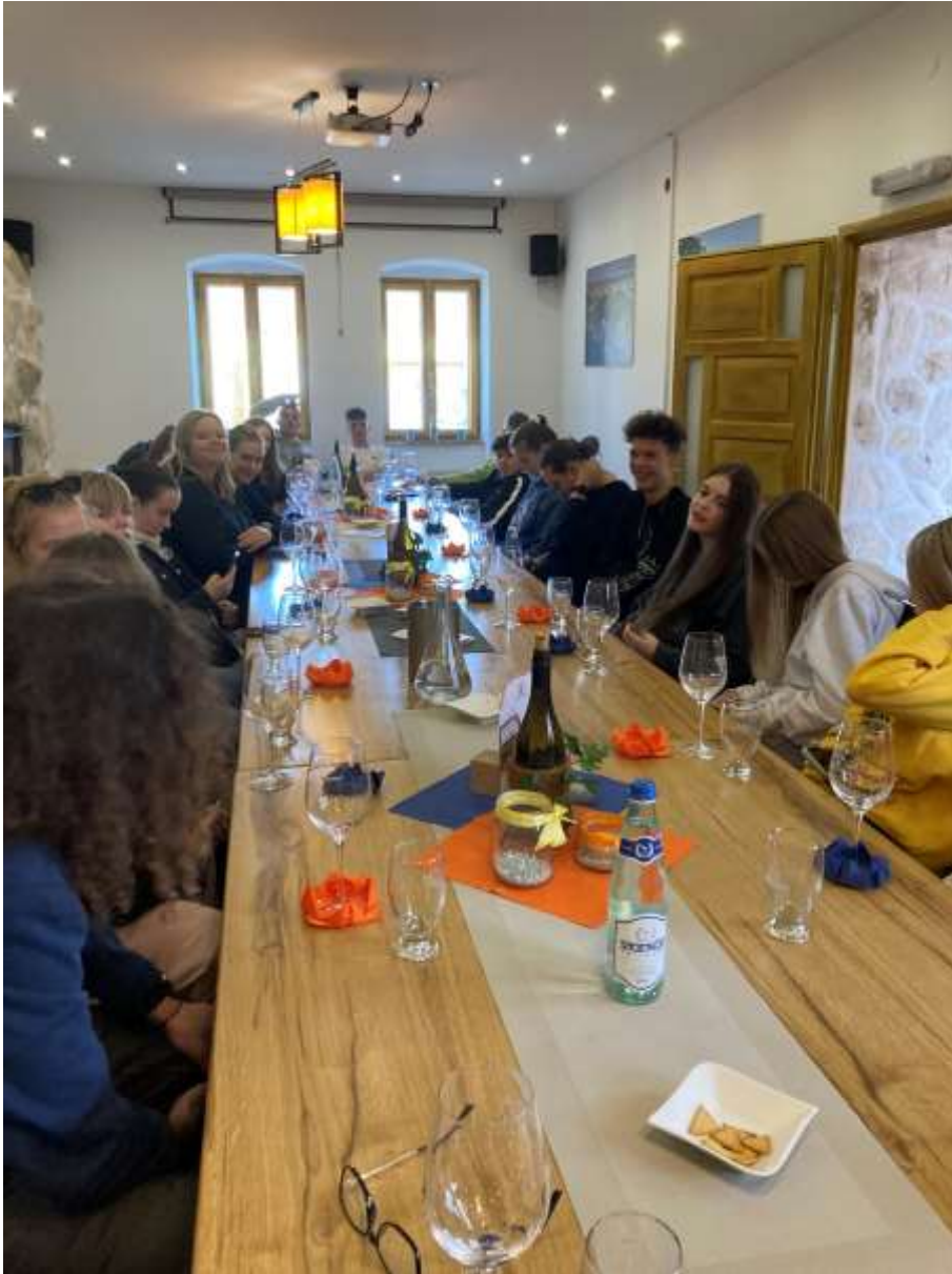
Budapest, Kispesti Deák Ferenc Gimnázium