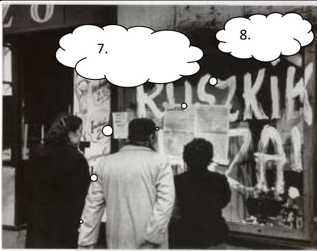
Október 28-án a Nagy Imre kormány demokratikus forradalomnak minősítette az eseményeket, tüzszünetet hirdetett, megkezdtek az ÁVH leszerelését, bevezették a többpártrendszert.