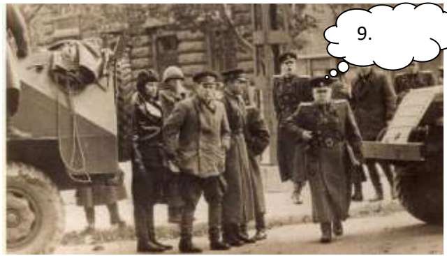
A szovjet vezetés látszólag tudomásul vette a magyarországi változásokat, valójában a fegyveres beavatkozást készítették elő.